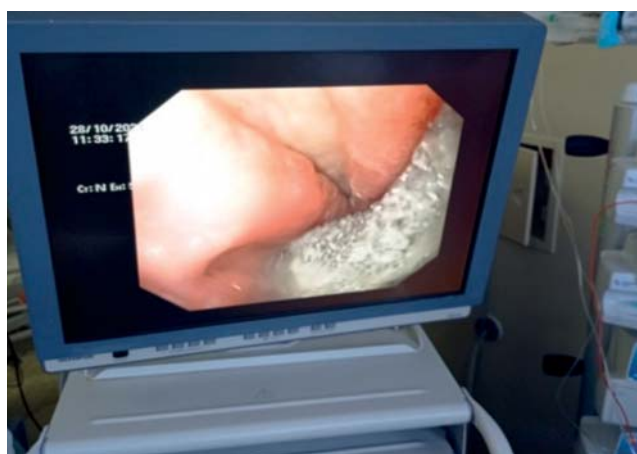
Рис. 2. Эндофото: губка на зонде установлена в области несостоятельности гастроэнтероанастомоза.

Fig. 1. Final stage of the revisional relaparoscopy at gastrojejunostomy leakage after Roux-en-Y gastric bypass: 1 — drains at the leakage zone; 2 — feeding gastrostomy.